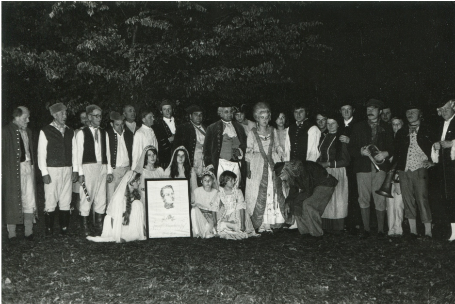
„Lucerna“ - 1973

Lumierů“, OB Zavlekov – „Staročeské aktovek“, ZD DaS Plzeň – „Akce H“, OB Makov – „Reprezentant domu“.