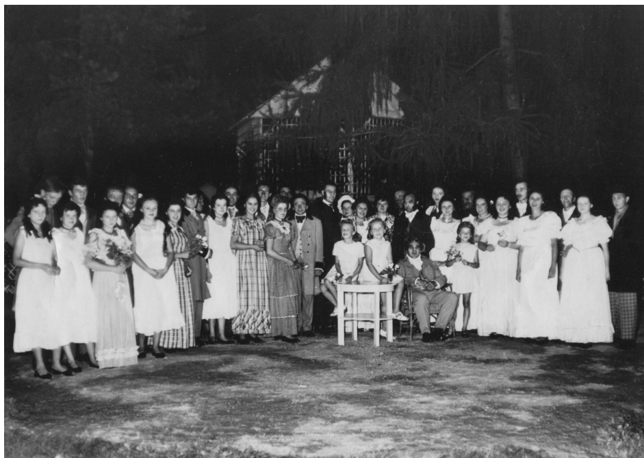
„Čekanky“ - 1963

Jak je patrné, začátkem 60-tých let začíná stoupat laťka ochotničení, což lze usuzovat přítomností souborů více vzdálených a souborů městských. Tradiční soubory zejména z okolí začínají zanikat.